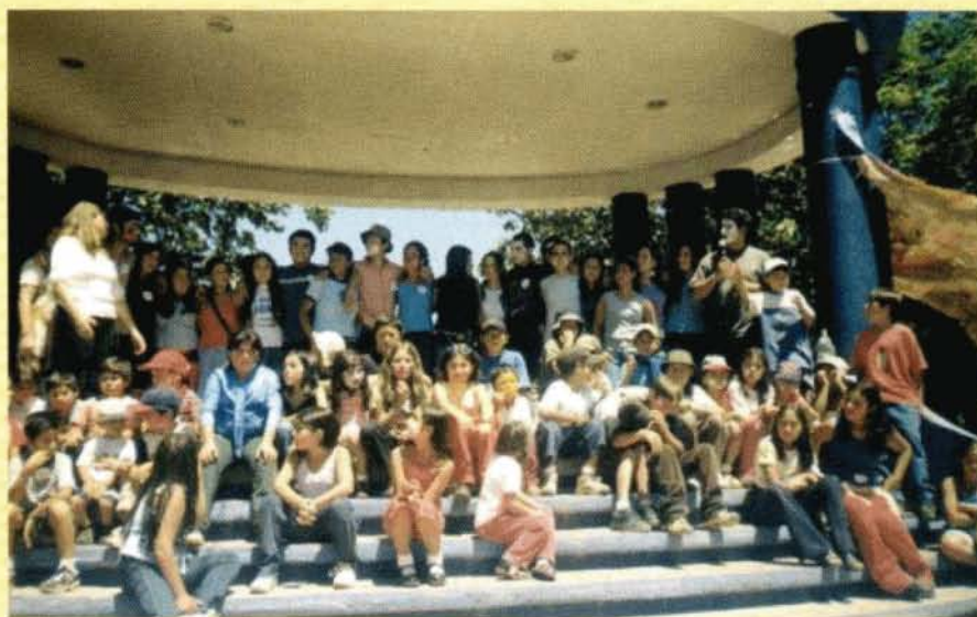
EN LA PLAZA CENTRAL DE LOTA. - Un aspecto de la actividad final de trabajos con niños entre 7 y 13 años efectuados por el Grupo Alemanque de nuestra Academia.