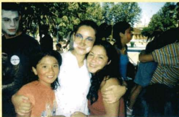
AL FINAL DE LOS TRABAJOS.- Los integrantes del Grupo Alemanque aparecen rodeados de niños y jóvenes de Lota al concluir los trabajos voluntarios realizados en esa ciudad.

Para el año 2003 las organizaciones populares de Lota con que trabajamos durante 13 días, habrán levantado a pulso y sudor la "Casa de la Infancia Lotina". Nosotros participamos y apoyamos aquellos pasos que los encaminarán a una victoria ante los intereses mercantiles que atentan en contra de la vida comunitaria. El Grupo de Intervención Comunitaria Alemanque desea profundamente ser una ayuda para lograr ese anhelo".