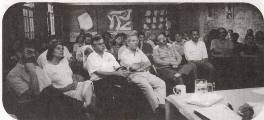
Una de las sesiones plenarias realizada en la sala de reuniones en Schoenstatt, en la que tomaron parte académicos, estudiantes y funcionarios administrativos de nuestra Academia, para analizar la agenda postautonomía que finalizará con un Claustro Pleno en este año 2000.

• Sistema de tutoría en que se "personalice" la relación de la Universidad con el estudiante y que la formación fundamental surja de la relación "profesor alumno". Habría que analizar lo que significa en cuanto costo de la educación.