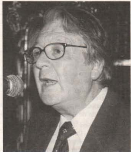
Nuevo Director Académico