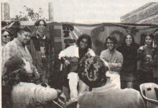
Estudiantes de Periodismo, tras la inauguración de la Sala de Redacción.