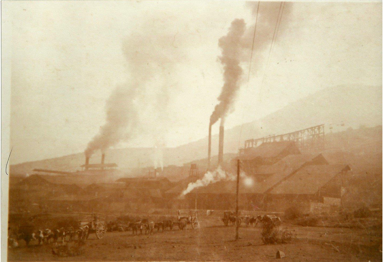
Fundición La Poza