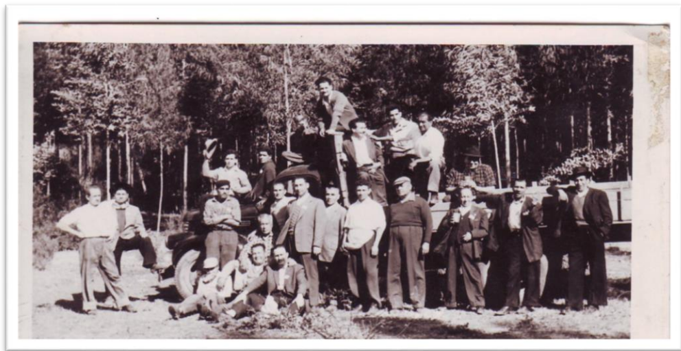
Recreación de trabajadores 1965