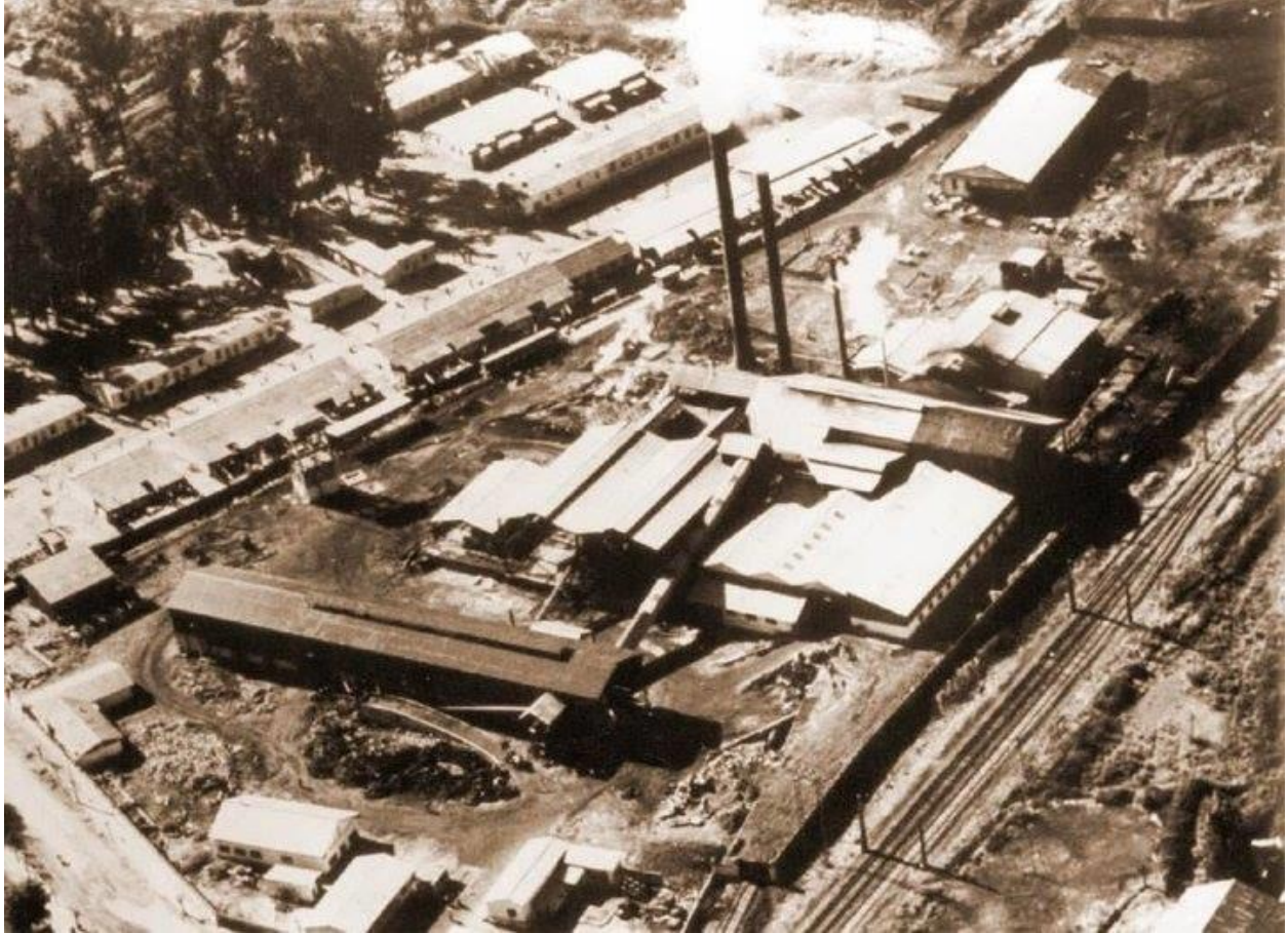
Fundición Chagres