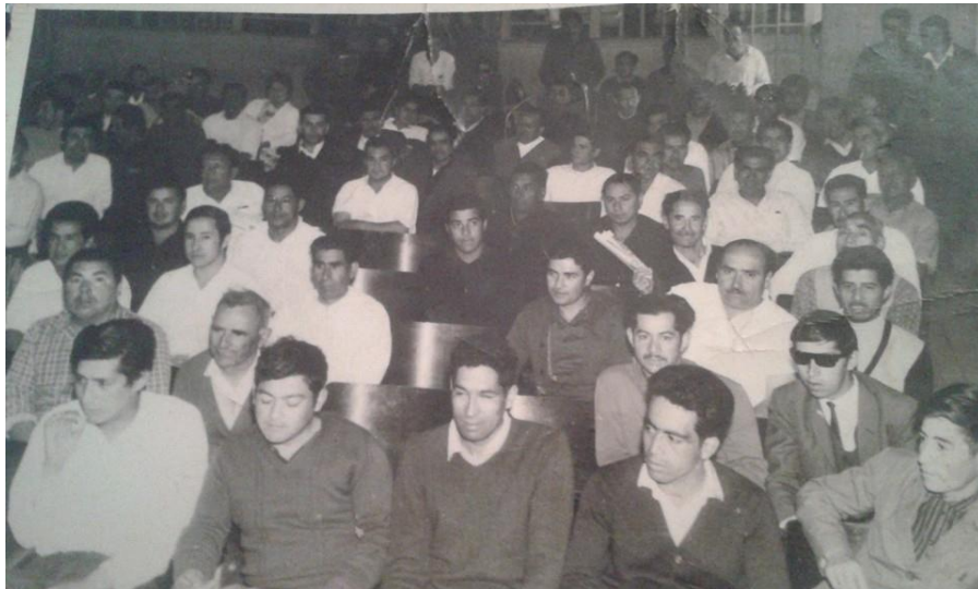
Asamblea de trabajadores