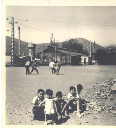
Niños jugando a metros de la industria (archivo personal)