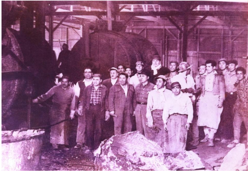
Trabajadores 1960