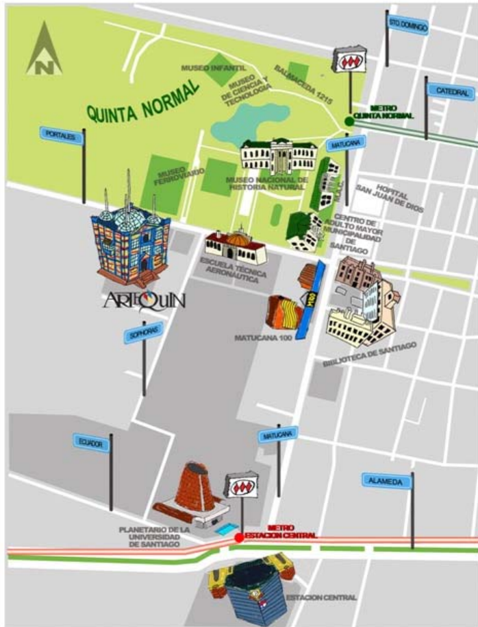
Mapa de servicios cercanos a Villa Postales (Fuente: Arlequín).

Los servicios presentes en la Comuna de Estación Central se encuentran en un radio de treinta cuadras, relativamente cercanos a la UVP 103 .