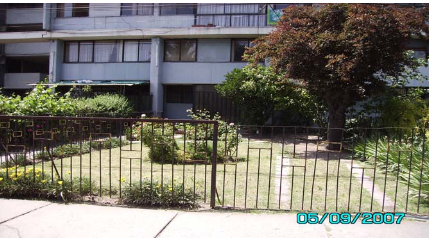
Parte posterior del bloque 18 frente a Plazuela Las Higueras y bloque 15.