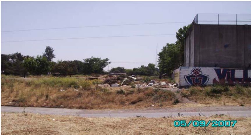
Esquina de Avenida Las Encinas y El Arrayán. Al fondo juegos de Plaza del Encuentro (Plaza Mayor) y "el sube y baja".