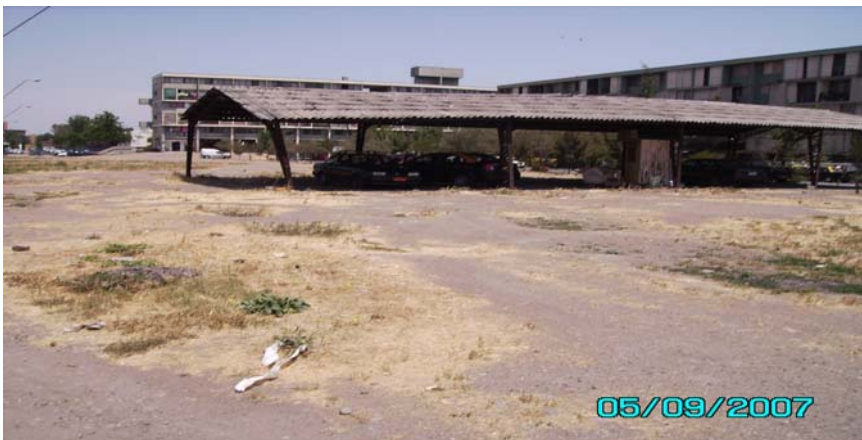
Espacio usado de estacionamiento, frente a Club de Pensionados y Parroquia Jesús Maestro. Al fondo bloques 3 y 11.