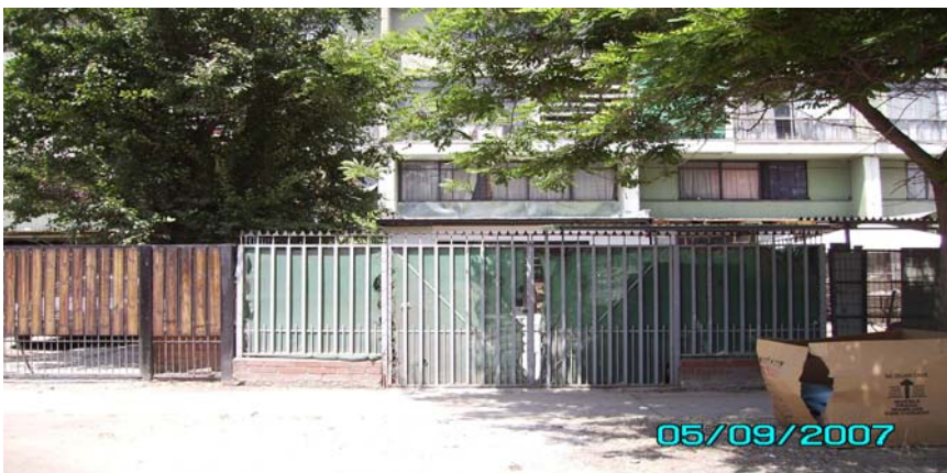
Parte trasera del bloque 19 frente al bloque 17 y a la Plazuela El Naranjo.