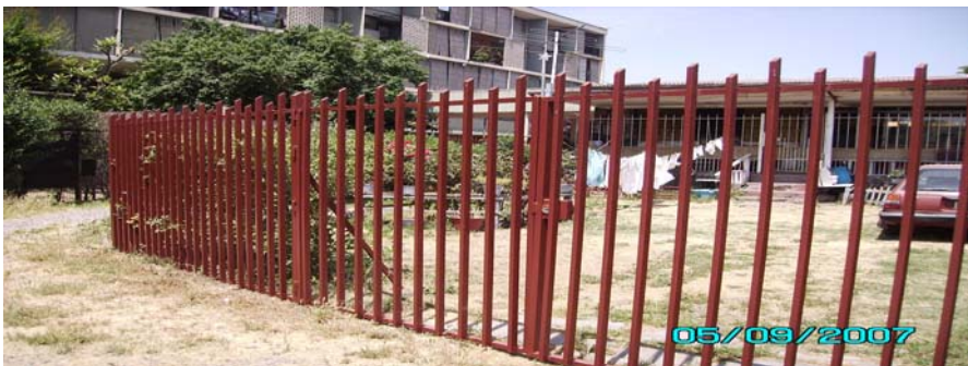
Plazuela El Sauce, Bloque 7 con cierres naturales.