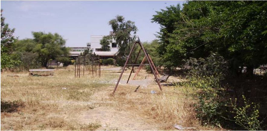
Plazuela El Peumo, juegos abandonados.