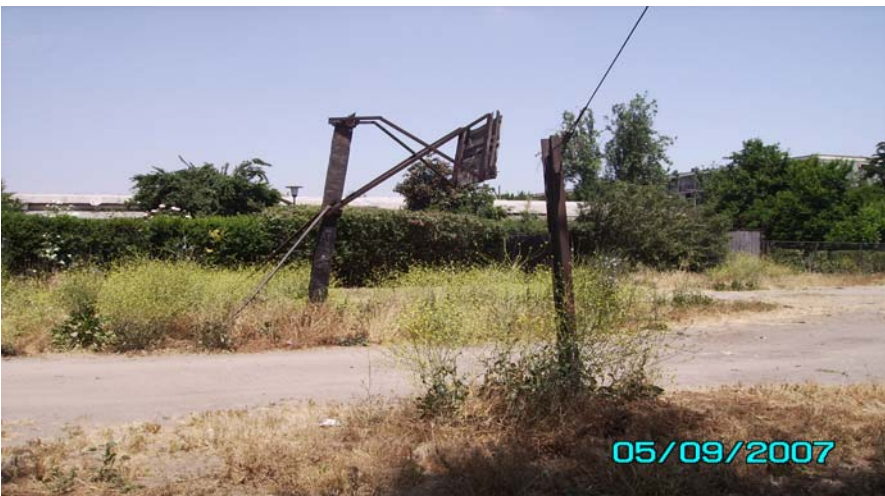
Antigua Cancha frente al bloque 6.