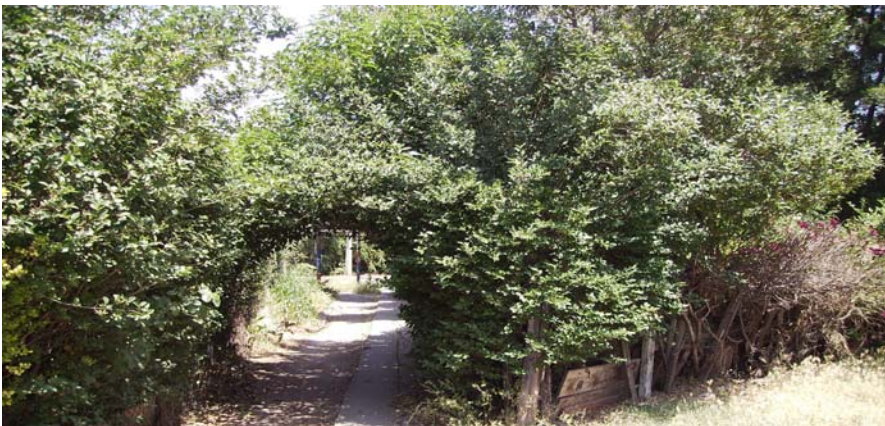
Avenida de Ligustrinas entre bloque 6 y bloque 7.