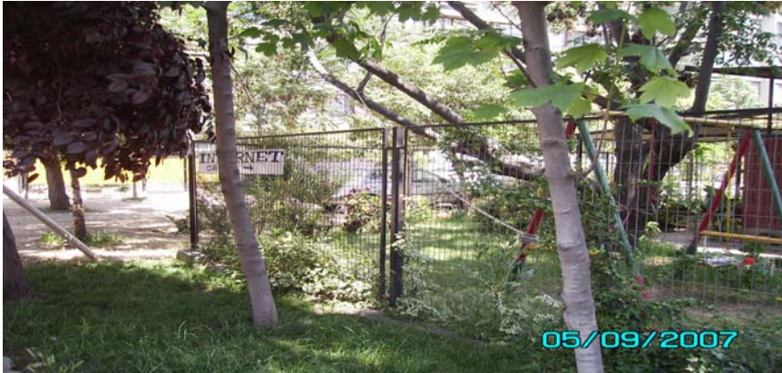
Plazuela Las Higueras entrada frente al bloque 18 casa esquina.