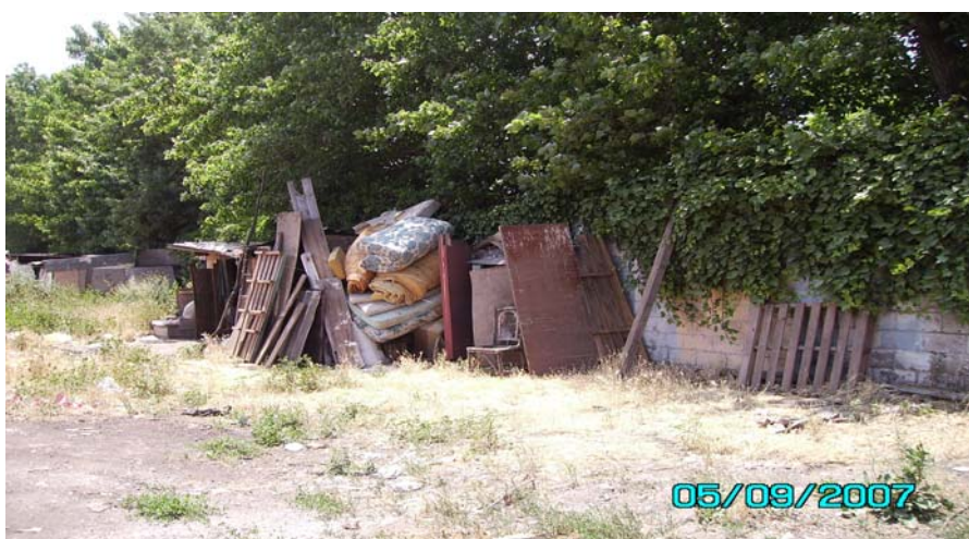
Rucos de indigentes en el sector mencionado.