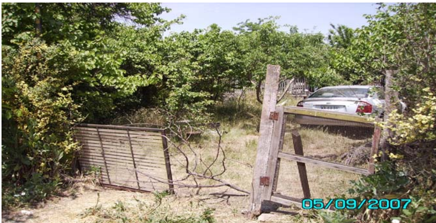
Costado de Plazuela El Peumo, cierre improvisado del patio de una casa.