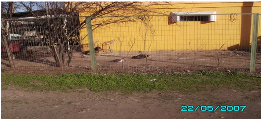
Enrejamiento en primer piso del bloque 14 por Avenida El Arrayán.