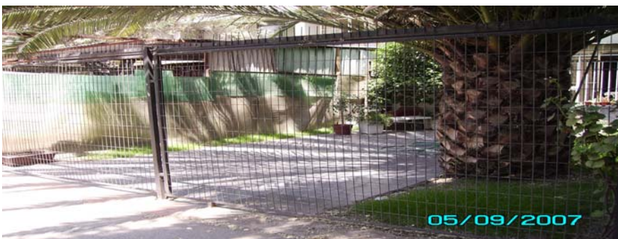
Apropiación con enrejado. Casas Plazuela El Nogal entre bloques 1 y 6.