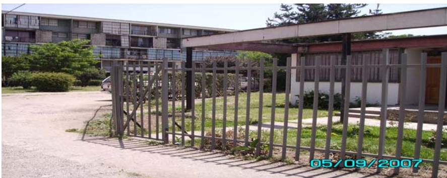
Casa Plazuela El Cerezo. Al fondo el bloque 9 con cierres naturales.