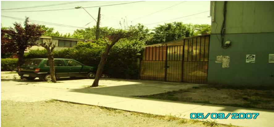
La puerta de madera corresponde al departamento del primer piso del bloque 17. Se extiende la apropiación con ligustrinas naturalmente hasta las casas de la Plazuela El Naranjo.