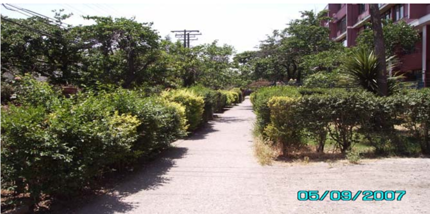
Cierres naturales. Casas de Plazuela El Naranjo entre los bloques 16 y 17.