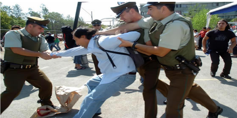
Fotografía de una detención, día de firma de contrato de Quiero Mi Barrio.