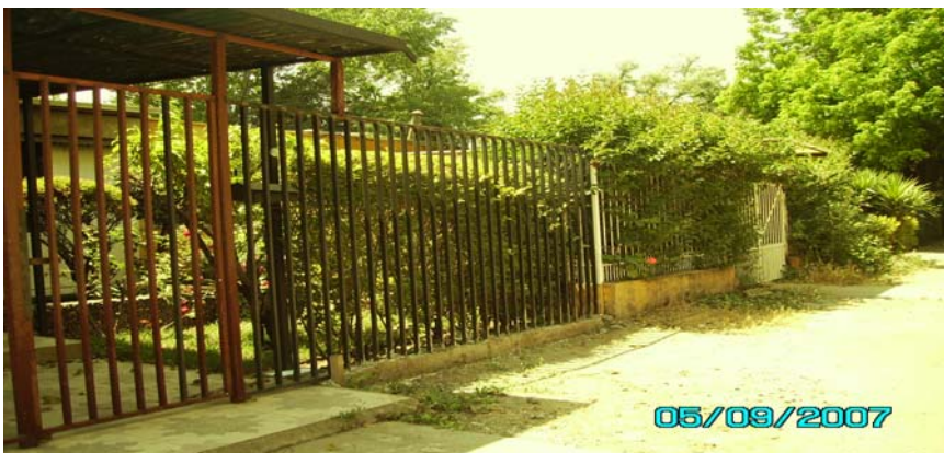
Casas frente al bloque 18 detrás de Plazuela Las Higueras.