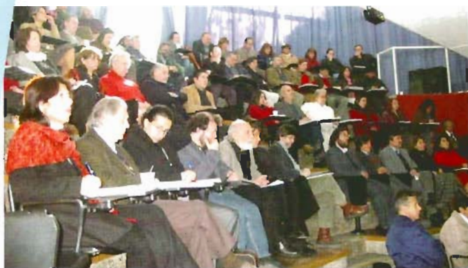
Autoridades, directores, jefes de carrera y docentes, asistieron al encuentro sobre el proceso de acreditación.

E n diversas instancias de nuestra Universidad se iniciaron los debates sobre el proceso de acreditación de esta casa de estudios, en el marco de las orientaciones entregadas por la Comisión Nacional de Acreditación de Pregrado (CNAP), dependiente del Ministerio de Educación.