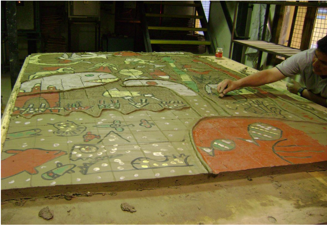
Piezas Quemadas en Horno Cerámico.