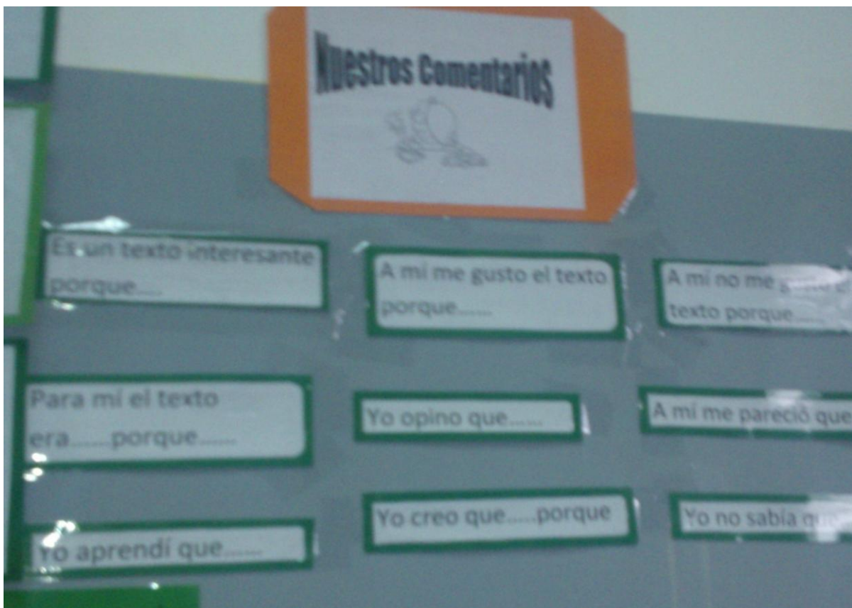
Foto de la sala de clases con el material, utilizado como guía para el trabajo de los alumnos.