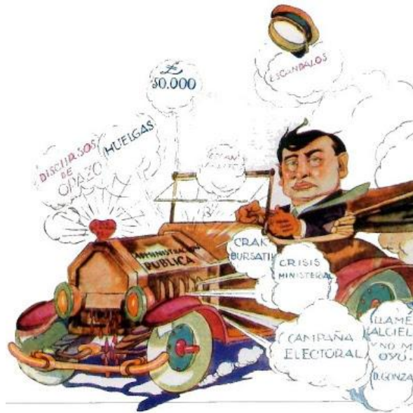
Caricatura que presenta las dificultades del gobierno de Alessandri.

desde fuera’’ 145 , con el propósito de reducir la hegemonía de la tradicionales y modernas oligarquías.